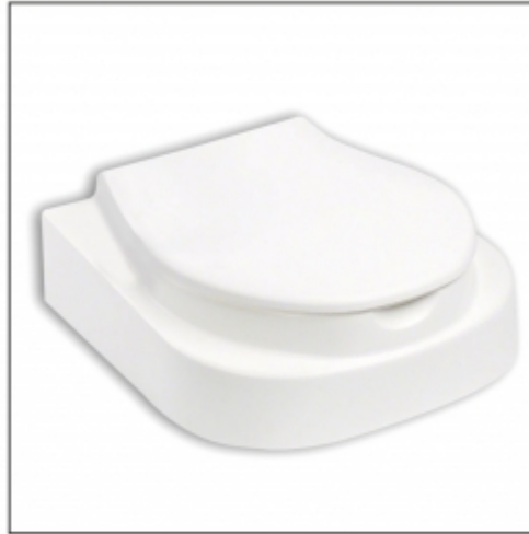
Ref.: AD510DS Sin reposabrazos. 3,6 kg.