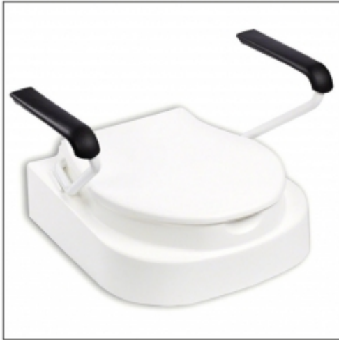
Ref.: AD510D Con reposabrazos. 5,4 kg.